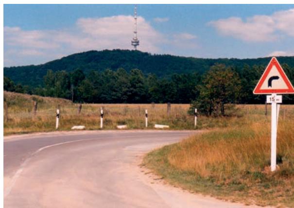
Übungsstraße mit Blick zum Fernsehturm