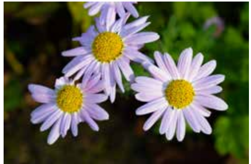
Ein Blumengruß vom Queller Blatt