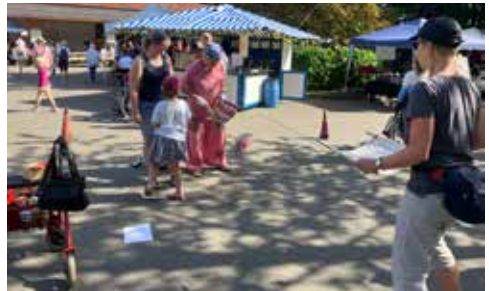
Unterhaltung für große und kleine Besucher