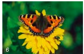
6 Kleiner Fuchs (Archivfoto, alle anderen Fotos: D. Kunzendorf)