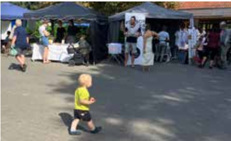
Apfelschmaus für unterwegs