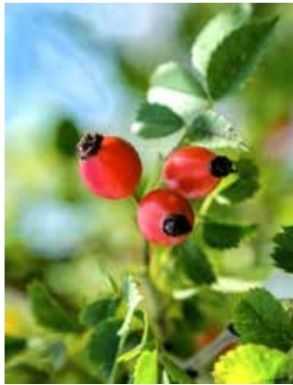
Hagebutten – Superfood aus der „Natur-Drogerie“

Ich mag am liebsten die Tage, wenn die Sonne die bunt gefärbten Blätter zum Leuchten bringt. Dann mache ich mich auf zu meiner Hagebutten-Tour. Der Herbst hat diese kleinen Früchtchen nämlich überall wachsen lassen, wohl extra für solche Leute wie mich, die keinen eigenen Garten haben. Mit dicken Handschuhen gegen die Stacheln und einem Jutebeutel im Rucksack starte ich zur Hagebutten-Ernte. Lange suchen muss ich nie, denn aus den Sträuchern am Wegesrand lachen sie mir schon von Weitem entgegen. Pflücken sollte man sie am besten, wenn sie richtig schön rot, aber noch etwas fest sind. Ernten kann man sie übrigens bis in den Dezember hinein; wenn sie Frost bekommen haben, werden sie sogar besonders süß.